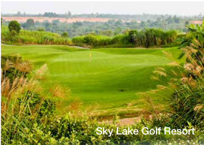
Sky Lake Golf Resort