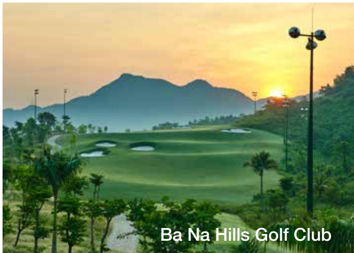
Ba Na Hills Golf Club