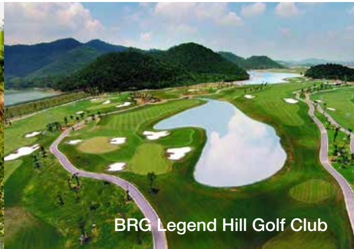
BRG Legend Hill Golf Club

ราคาเริ่มต้น: 12,999 บาท/นักกอล์ฟ 1 ท่าน ราคาต่อผู้ติดตาม 1 ท่าน: 2,499 บาท