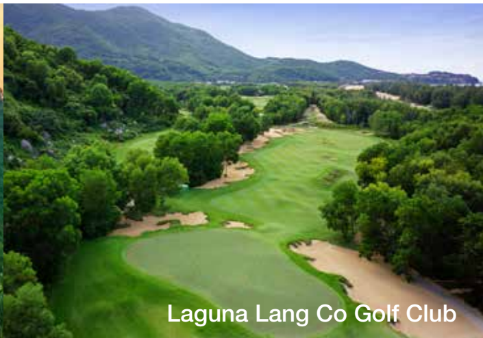
Laguna Lang Co Golf Club

ราคาเริ่มต้น: 19,999 บาท/นิกกอล์ฟ 1 ท่าน