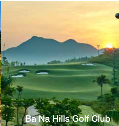
Ba Na Hills Golf Club