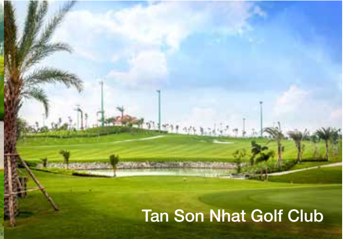
Tan Son Nhat Golf Club

ราคาเริ่มต้น: 11,799 บาท/นักกอล์ฟ 1 ท่าน