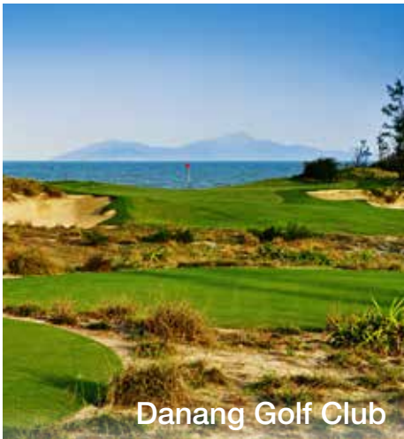
Danang Golf Club