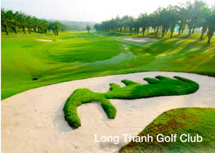
Long Thanh Golf Club